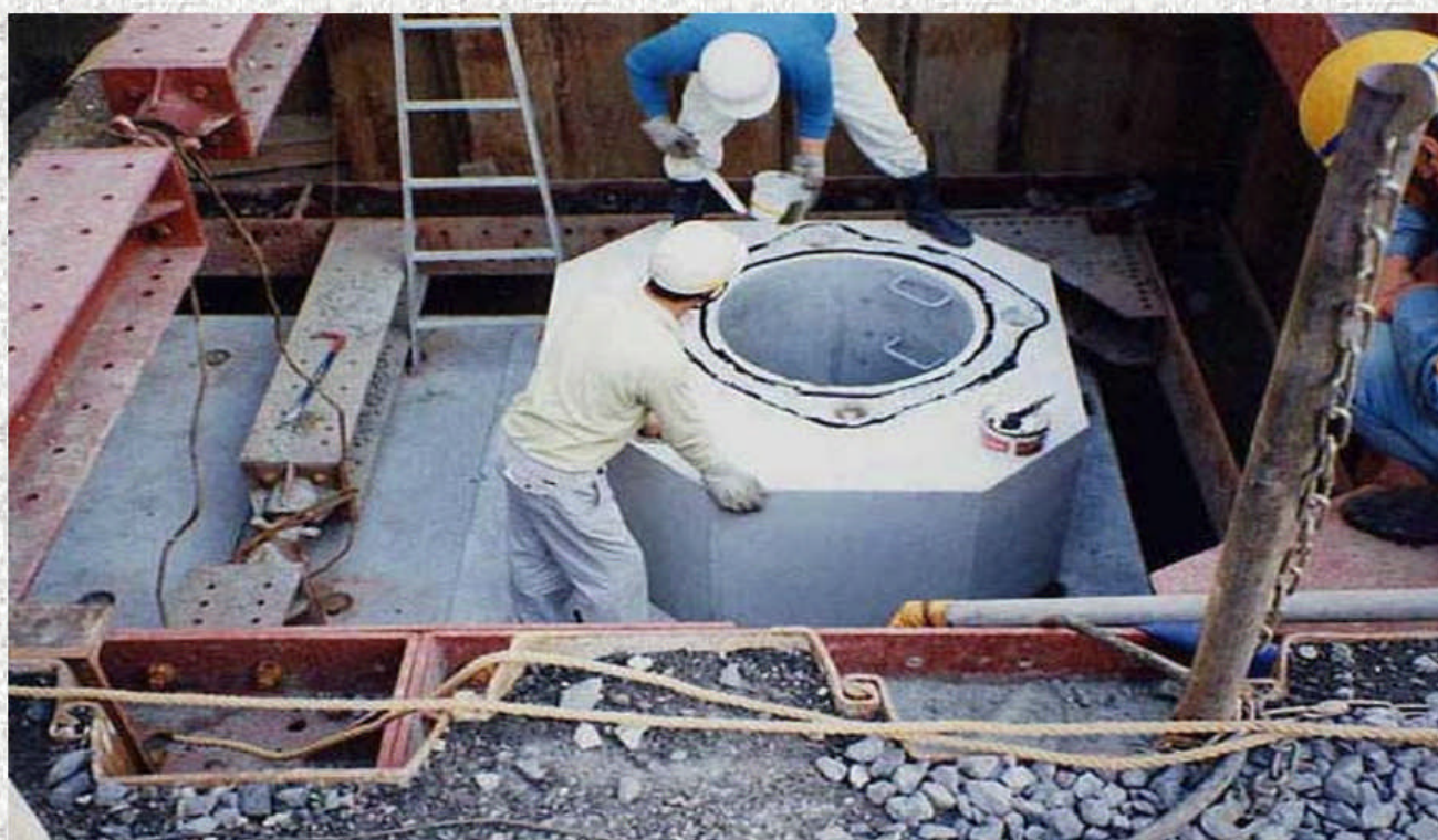
電力用マンホールの施工状況